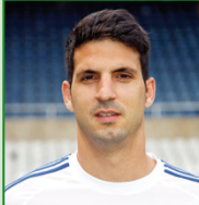
SAEZ DE ADANA